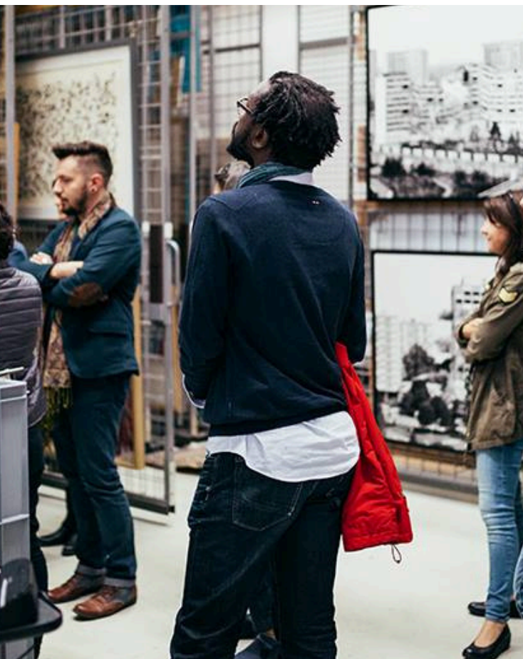
Vue des réserves du FRAC Alsace

Tous les ateliers et événements sont gratuits, sur inscription à www.frac-alsace.org .