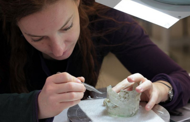
Restauration © Archéologie Alsace