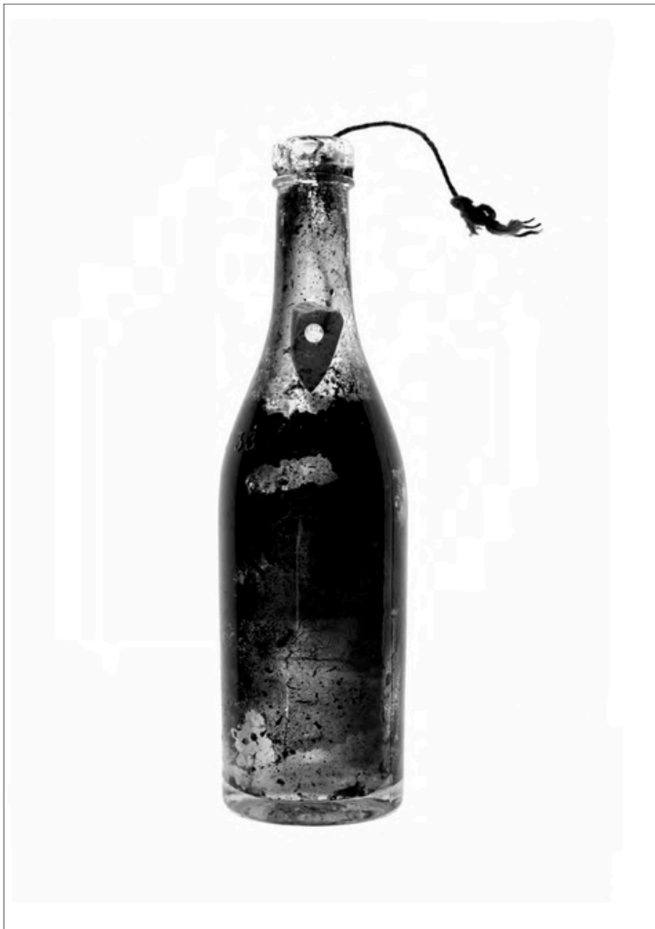
Estelle Hoffert, Le coin perforé

En assemblant des objets sur une plaque lumineuse, je réinterprète l'usage attribué par les archéologues au coin perforé. Je le réduis à une forme, faisant fi de la matière. De la même façon, je le sors de son contexte archéologique pour le présenter comme un objet polyvalent, évolutif, s'adaptant aux époques et aux besoins, ainsi qu'à notre propension à concevoir toujours plus.