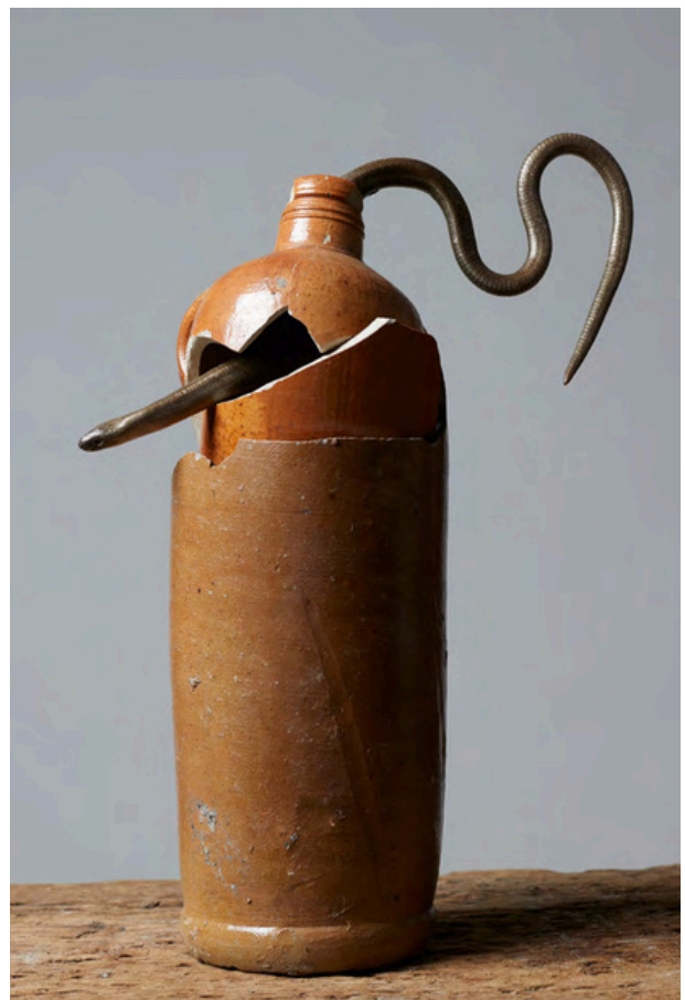
Estelle Hoffert, Assemblage de pot trouvés dans la benne et orvet momifié, collection de l'artiste