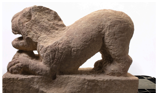
Lions sculptés, fin du 1 er siècle, grès rose, découverts route des Romains à Strasbourg en 2018, collection Archéologie Alsace