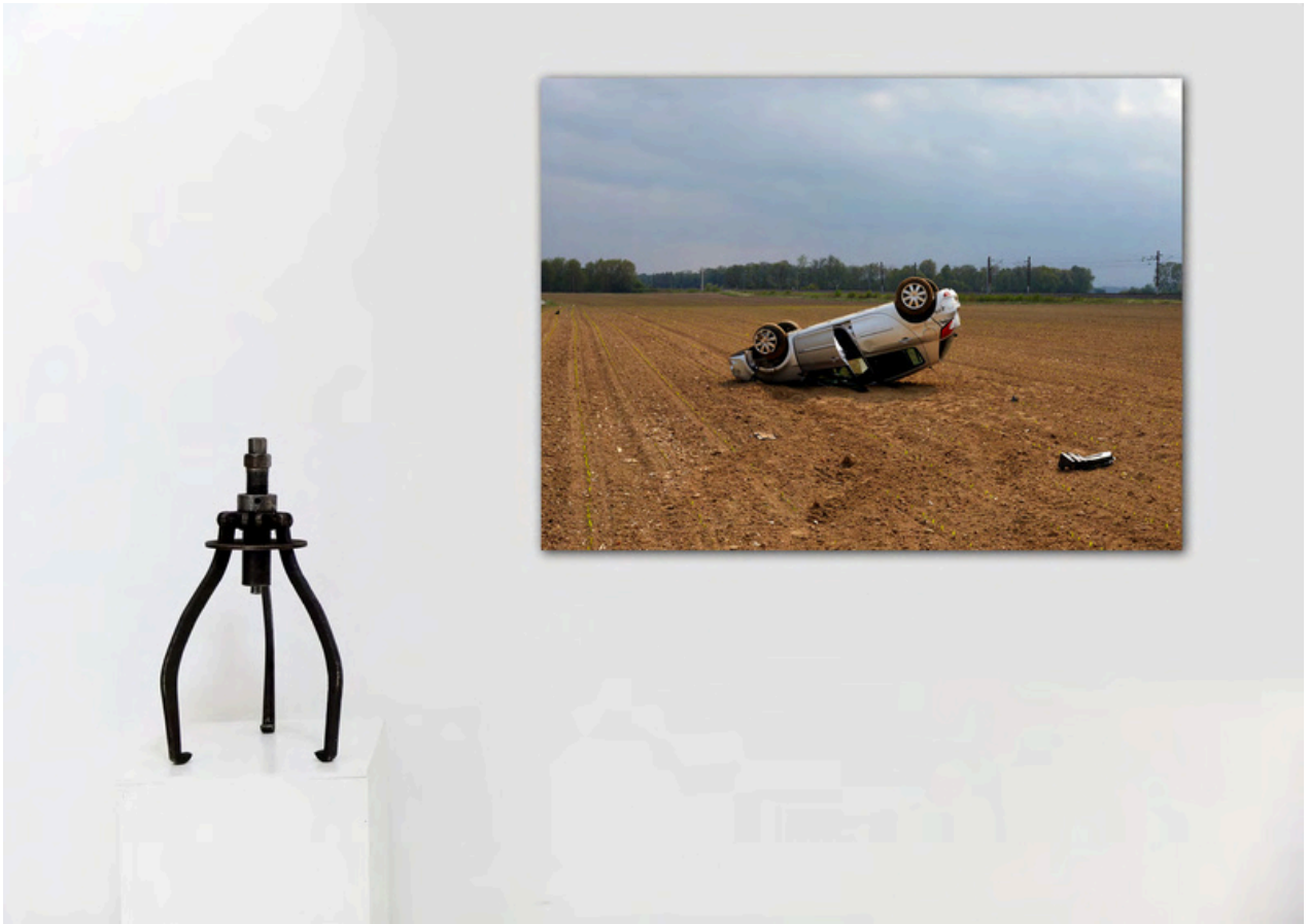
Estelle Hoffert, Machine à grappin - l'objet tombé du ciel